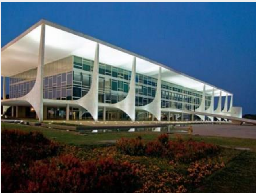
Palácio do Planalto – Sede do Poder Executivo (Local de Trabalho do Presidente da República)