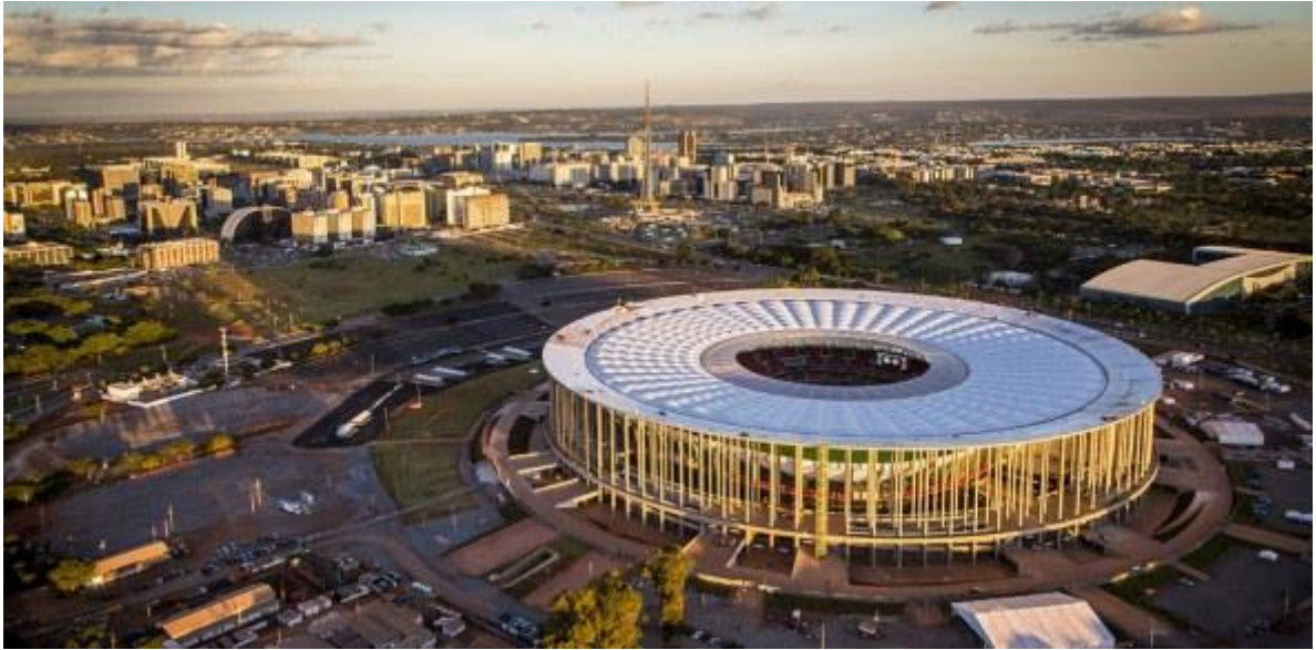
Palácio do Buriti: – Sede do Governo do Distrito Federal. Seu nome se deve a uma palmeira que é típica do cerrado, o buriti. Em frente ao palácio há uma cópia da famosa escultura da Loba Romana. – Vista panorâmica, de dentro do veículo.