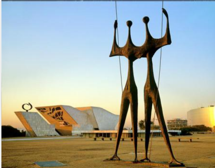
Escultura “Os Candangos” – ao fundo, Monumento Panteão da Pátria