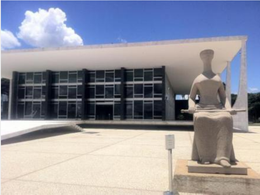
Supremo Tribunal Federal – Sede do Poder Judiciário